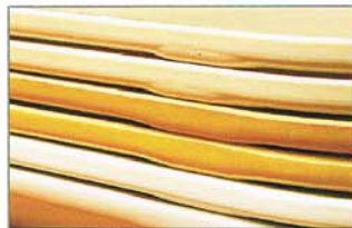
Stapelnocken ermöglichen ungehinderte Luftzirkulation für schnelles Trocknen und optimales Aufeinanderstapeln.