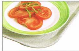
Versa Lite Century Tablett haben abgeflachte Kanten und ergonomische Ecken, die den Komfort erhöhen.