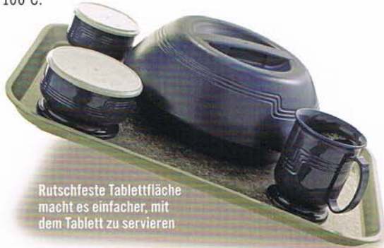
Rutschfeste Tablettfläche macht es einfacher, mit dem Tablett zu servieren