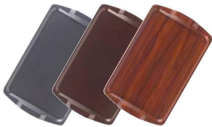
Capri – Rechteckig mit Griffen Seite 32