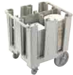
Versa Geschirrwagen Seite 190