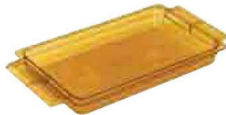
H-Pan Schale mit Griffen Seite 114