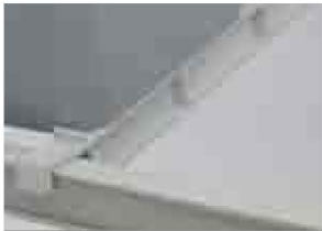
Speiseschalen-Trennleiste Für Camshelving® Seite 88