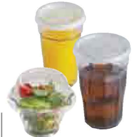
Wiederverwendbare Camlids™ Seite 54, 175