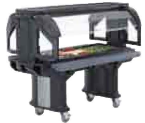
Versa Speisebüffets Seite 124