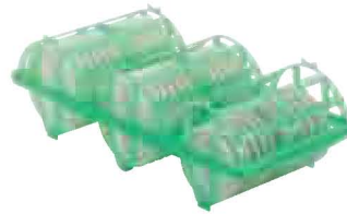
Camrack® Spül- und Aufbewahrungskorb Seite 174