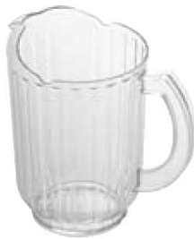
Preisgünstiger Krug aus Polycarbonat Seite 51