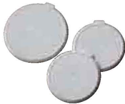
Wiederverwendbare Camlids™ Seite 174