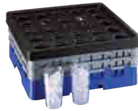
Camrack® IceExpress Abfüllschablone für Gläser Seite 53, 201