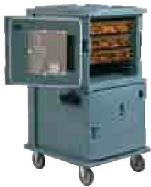
Ultra Camcart® UPCH1600(2) Seite 162